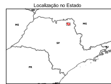
Localização no Estado